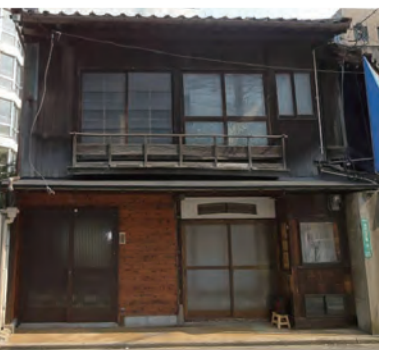
清川ロータリー横に建つ趣ある古民家