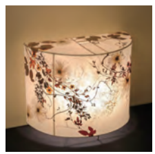
押し花や押し葉を貼ったランプシェード

築不詳の古民家は、これまで「ギャラリー 柳(なぎ)」としていろいろな方に時々利用していただけてきましたが、これからは1階の和室を「花あかり」(=和紙に自然の植物をあしらったランプシェードの照明器具)のショールームとします。今回はそのお披露目を兼ねて、この古民家を開放します。まだ修理修復の途中ですが、古い生活道具や竹製品とともにご覧ください。