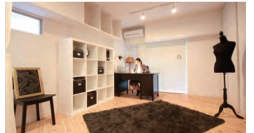
203号「カジュアル・ハイエンドなSOHOスタイル」

※状況によりご見学いただけるお部屋が変動しますので、当日エレベーター内に掲示してお知らせいたします