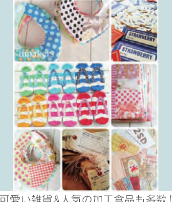
可愛い雑貨&人気の加工食品も多数!