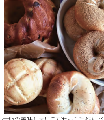
生地的美味しさにこだわった手作りパン