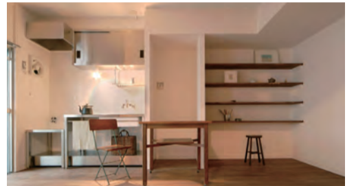
607号「日本画と暮らす」